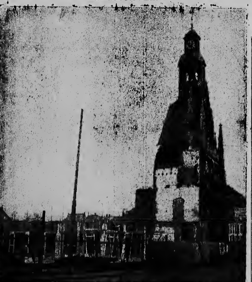
In de Hinthammerstraat te 's Hertogenbosch staat een oude Kapel-gevel. Achter deze gevel wordt een tehuis voor oude van dagen gebouwd. De foto toont de werkzaamheden achter de gevel.

verslaggever van La Esfera verteld dat zijn bedrijf sinds een jaar atoom-energie gebruikt bij de oliewinning. Een z.g. atoominsulter-apparaat wordt o.a. aangewend om de verschillende gassen te registreren, die bij het boren vrij komen. Hij verklaarde tevens dat zijn bezoek aan Amerika mede in verband staat met een mogelijk gebruik van grotere en moderne atoominstallaties in Venezuela te installeren om de winning van olie te intensiveren.